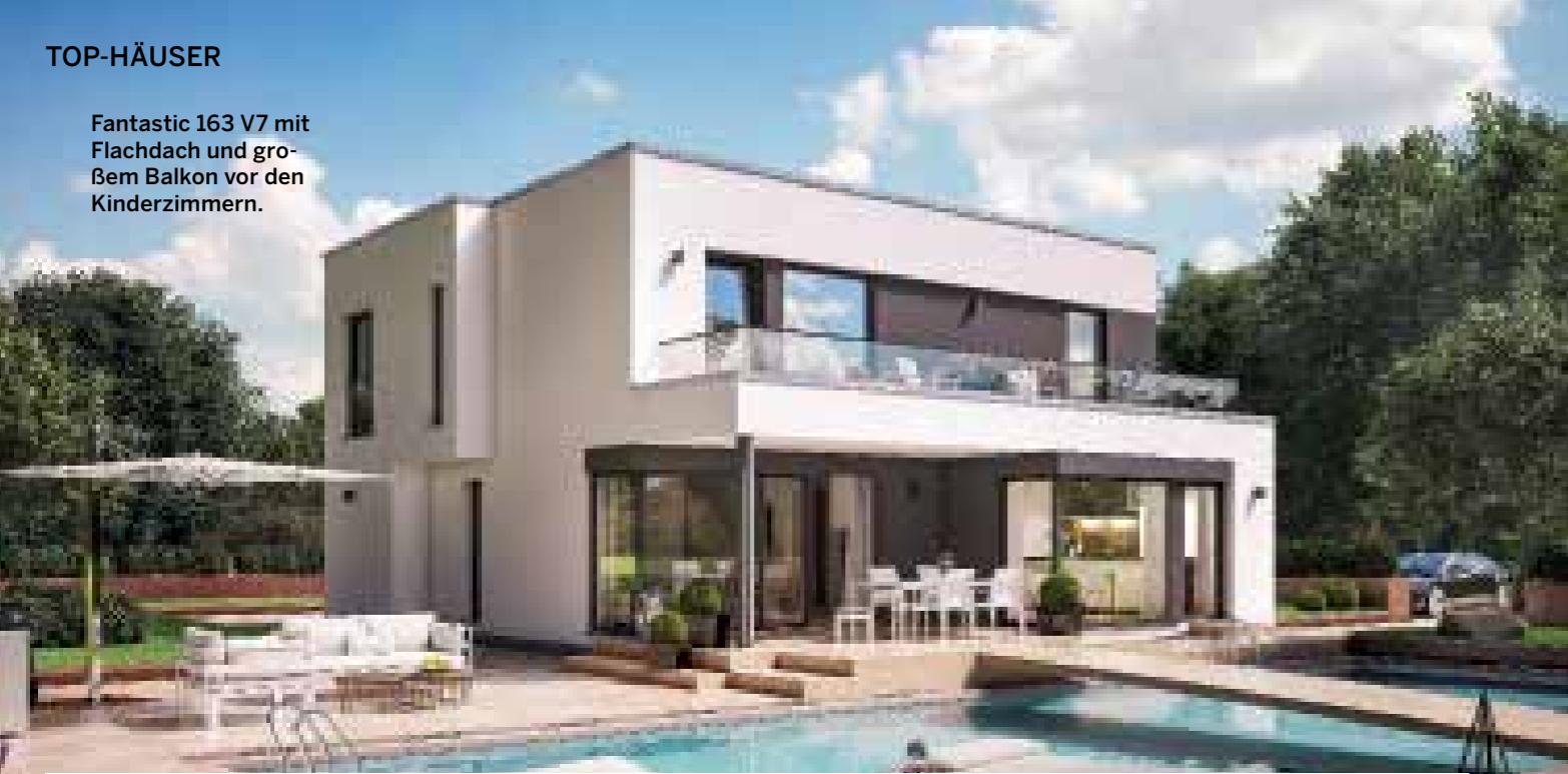
Fantastic 163 V7 mit Flachdach und großem Balkon vor den Kinderzimmern.

Variables Designhaus für moderne Wohnkonzepte