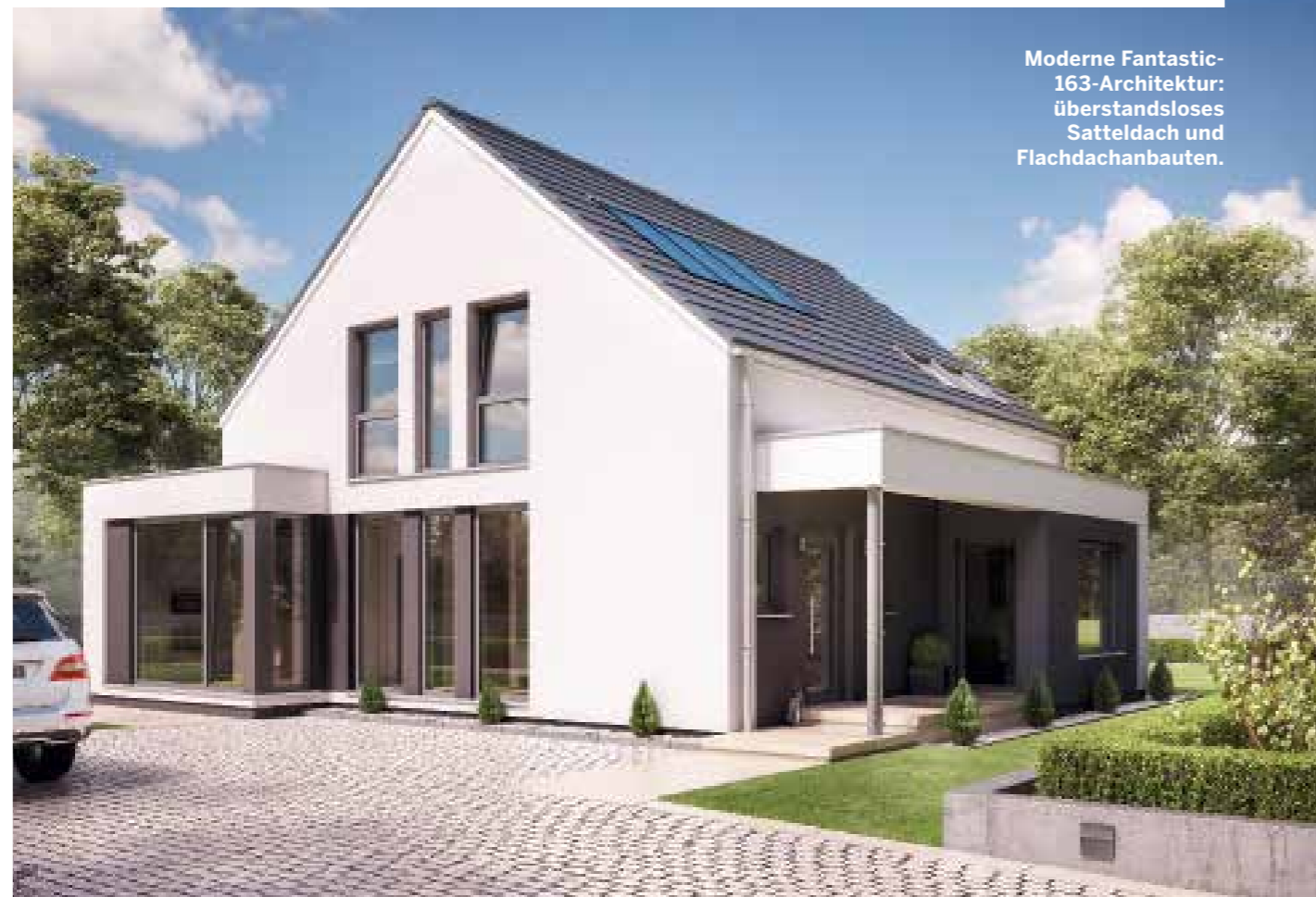
Moderne Fantastic-163-Architektur: überstandloses Satteldach und Flachdachanbauten.

Hier gleich das erste Beispiel: das Fantastic 163. Die Beispielgrundrisse zeigen die Flachdachversion V7 mit 166 Quadratmetern Wohnfläche, die durch viele ergänzende Bauteile, unterschiedlichste Dacharten, Erker- und Giebelvarianten sowie Designpakete zum individuellen Eigenheim werden kann, wie die Satteldachvariante V2 mit 162 Quadratmetern beweist. Die Hauptzutaten seines Erfolgsrezepts: raumhohe Glaselemente und eine offene Raumstruktur, ausgestattet mit zukunftsweisender Haustechnik für ein Leben mit Komfort.