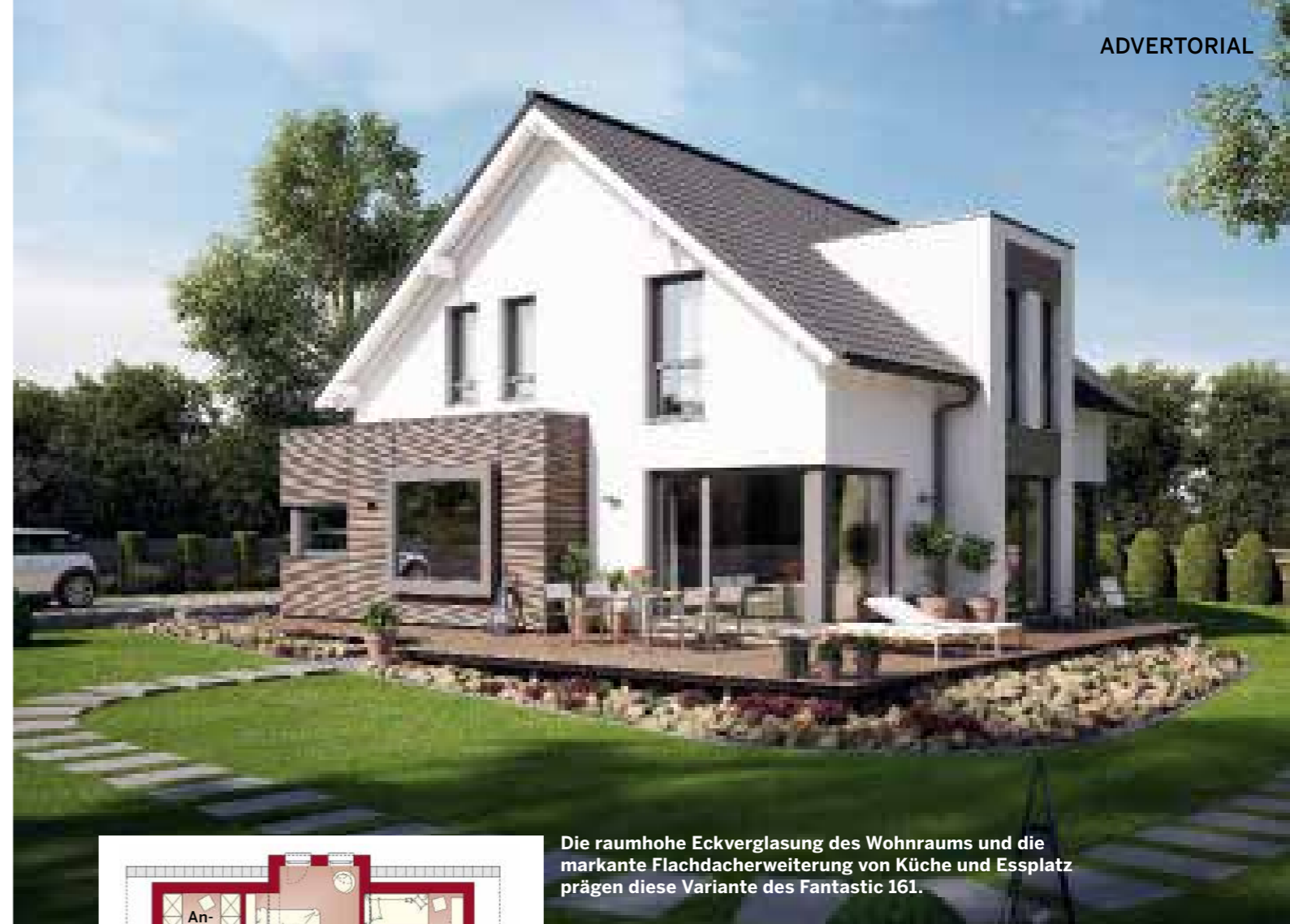
Die raumhohe Eckverglasung des Wohnraums und die markante Flachdacherweiterung von Küche und Essplatz prägen diese Variante des Fantastic 161.