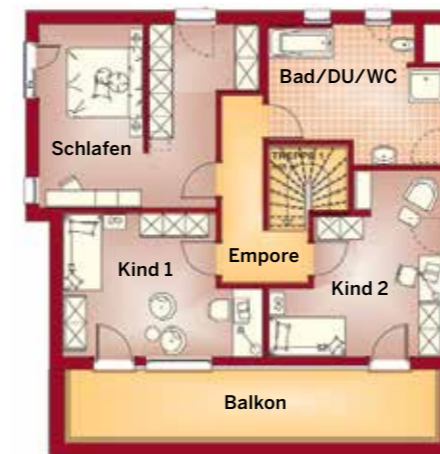
Die Grundrisse des Fantastic 163 V7. Die Satteldachversion wurde unter anderem um einen Erker erweitert und der Hauseingang überdacht.