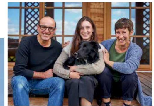
Zu einem baubiologisch tadellosen Haus wie diesem Domizil einer Schweizer Baufamilie (rechts) gehört auch eine baubiologisch einwandfreie Hausplanung.